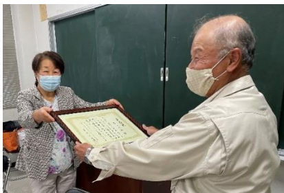
R3,10, 23 倉吉文化体育会館にて